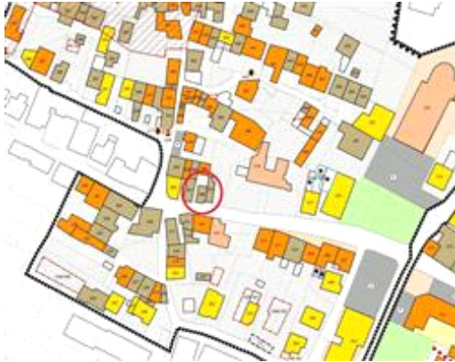
Piano degli Interventi

mista. Il traffico nella zona è locale, i parcheggi sono scarsi. Sono inoltre presenti i servizi di urbanizzazione primaria e secondaria.